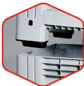
Система стыковки контейнеров для устойчивого штабелирования