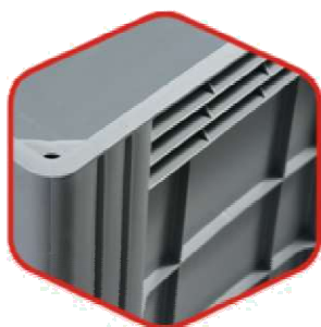
Усиленные стенки контейнера